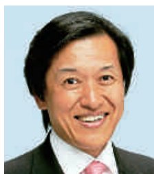
外務副大臣・衆議院議員

これからも、雇用、労働、医療、年金、介護、福祉、子育て支援、男女共同参画、食の安全など、生活の基盤を確立し、暮らしの安定を実現するため、職責をかけ全力を尽くす決意です。