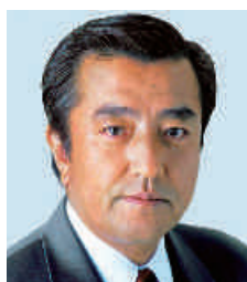
国土交通大臣政務官・参議院議員