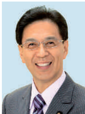
内閣総理大臣補佐官 民主党兵庫県総支部連合会 代表・参議院議員 水岡 俊一