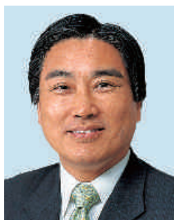
厚生労働副大臣・参議院議員